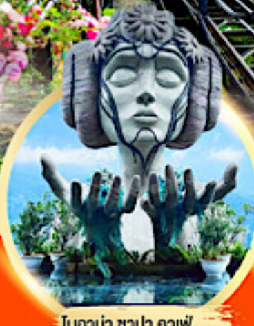
โมนาลิซ่า ซาปา คาเฟ่