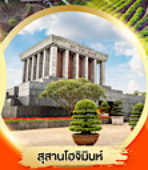
สุสานโฮจิมินห์