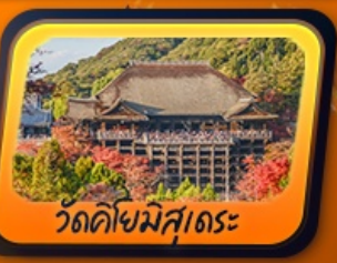
วัดคิโยมิสุเดระ