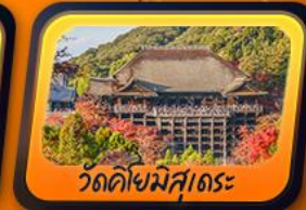
วัดคิโยมิสุเดระ

พักฟูจิออนเซ็น 1 คืน กิฟู 1 คืน โทยาม่า 1 คืน นาริตะ 1 คืน