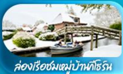
คลองเรือชมหมู่บ้านทีโรน

พิเศษ ล่องเรือแม่น้ำเซน ชมเมือง โดย บาโต มูช