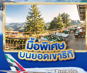
มือพิเศษ บินยอดเขารัก