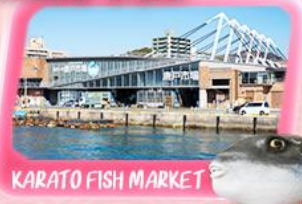
KARATO FISH MARKET