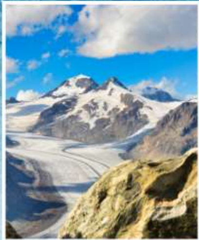
ALETCH GLACIER Riederalp, Bettmeralp