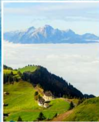
RIGI KULM Queen of the Mountains