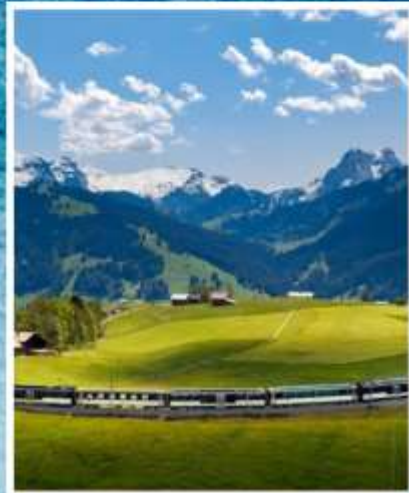
GOLDEN PASS LINE Montreux-Zweisimmen