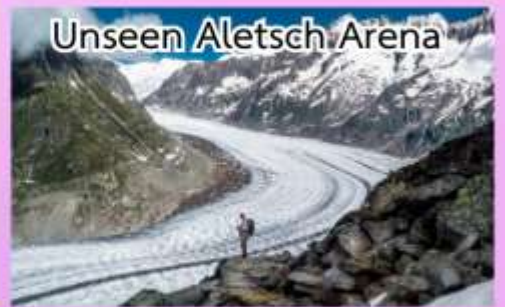
Unseen Aletsch Arena