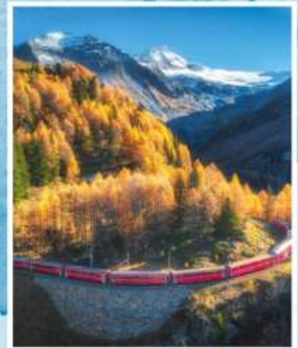
BERNINA EXPRESS Unesco