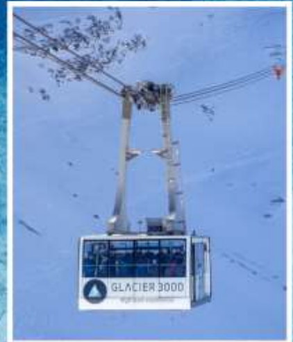
GLACIER3000 Peak walk by Tissot