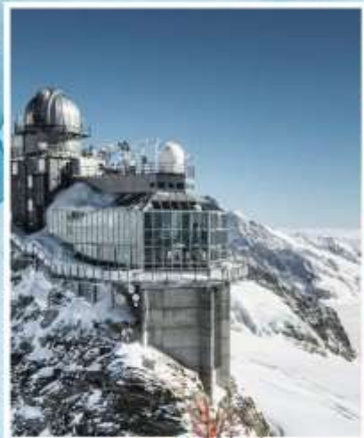
JUNGFRAUJOCH "Top of Europe"