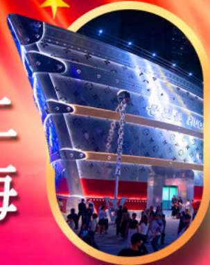
เรือคองคอลลิส