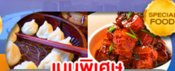
เมนูพิเศษ เสี่ยวหลงเปา หมูน้ำแดง เดินทาง ต.ค. 69 - มี.ค. 70