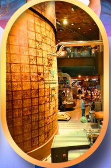
ร้านสตาร์บัคส์