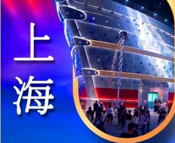
เรืออะทลันติก