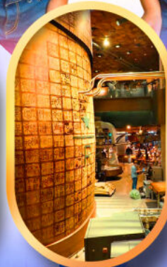
ร้านสตาร์บัคส์