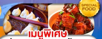
เมนูพิเศษ เสี่ยวหลงเปา หมูน้ำแดง เดินทาง ต.ค. 69 - มี.ค. 70