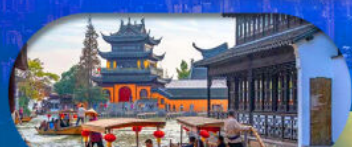
Zhujiajiao Ancient Town ล่องเรือเมืองโบราณ

เซี่ยงไฮ้ ดิสนีย์แลนด์ เมืองโบราณจูเจียเจียว