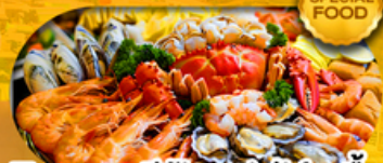
พิเศษเมนู ซีฟู้ดบุฟเฟ่ต์ 1 มื้อ เดินทาง มีนาคม 2569