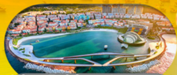
Kiss Bridge สะพานจูบ รวมค่าเข้าสะพานจูบแล้ว