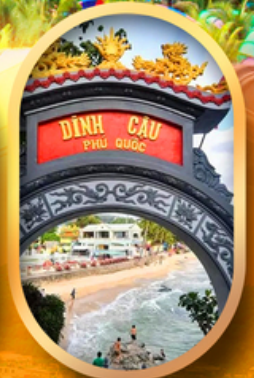
ศาลเจ้าดิงเกา