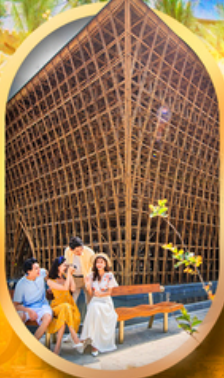
อาคารไม้ไผ่