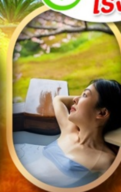
แช่ออนเซ็นญี่ปุ่น