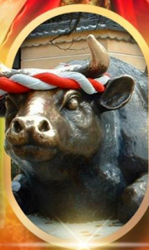
ศาลเจ้าดาไซฟุ