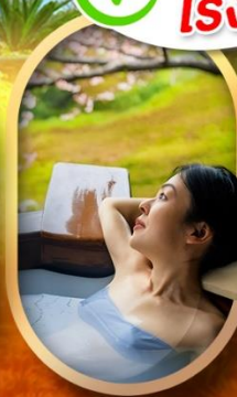
แช่บ่อออนเซ็นญี่ปุ่น