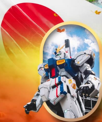
ห้างลาลาพอกันดั้ม