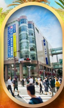
ช้อปปิ้งย่านเท็นจิน