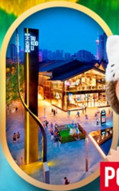
ถนนคนเดินไท่กู่หลี่