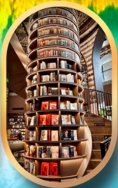
ร้านขายหนังสือ