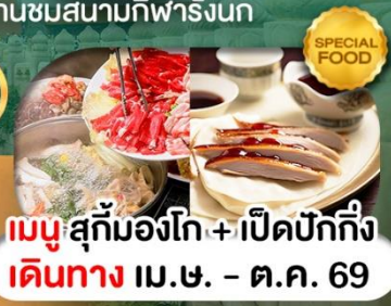
เมนูสุกั่มองโก + เปิดปักกิ่ง เดินทาง เม.ษ. - ต.ค. 69