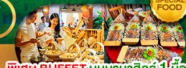
SPECIAL FOOD พิเศษ BUFFET; บันบานาฮิลล์ 1 มื้อ และ SEAFOOD BOAT เดินทาง มี.ค. - ต.ค. 69