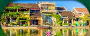
HoiAn Ancient Town ย่านเมืองเก่าฮอยอัน