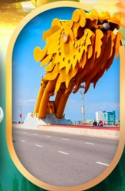
สะพานมังกรคานัง