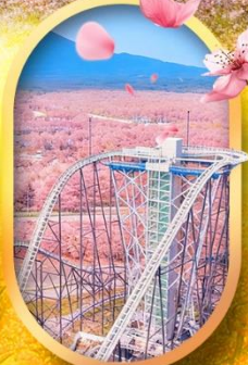
ฟูจิยาม่า ทาวเวอร์