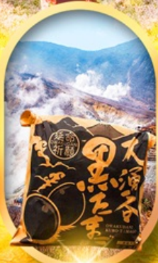
หุบเขาไอวาคุดานิ