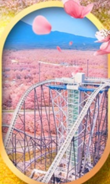
ฟูจิยาม่า ทาวเวอร์