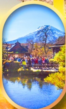
หมู่บ้านน้ำใส