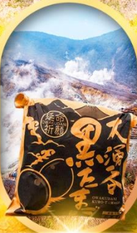
หุบเขาโอวาคุดานิ