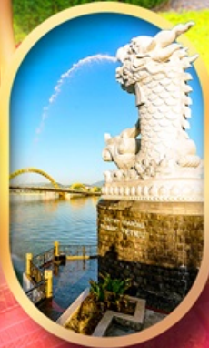
คาร์พดราท็อน