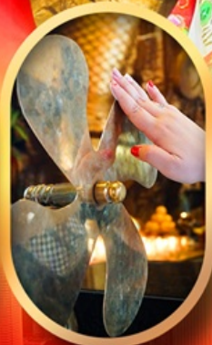
หมอนกั้งหันแซง