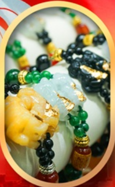
ร้านหยกอัญมณี