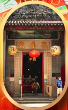
เจ้าแม่กวนอิมสองอ่า