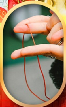
เสริมดวงความรัก