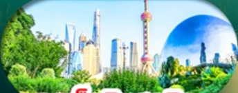
จุดเช็คอินสุดฮิต North Bund Shanghai

เซี่ยงไฮ้ หางโจว ล่องทะเลสาบซีหู ฟรีเดย์