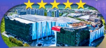
Crown Plaza Snow World Hotel หรือเทียบเท่า S+ 5 ดาว 1 คืน

เชียงใหม่ ดิสนีย์แลนด์ ไอซ์แอนดส์โนวเวิลด์