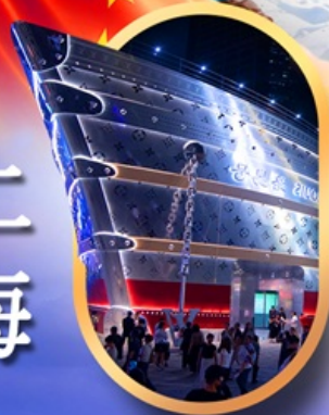
เรือคอะทูลยส์