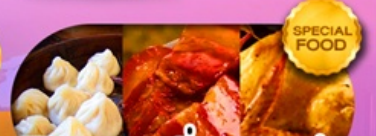
พิเศษเมนูเสี่ยวหลงเปา หมูตงพ้อ ไก่จอกาน เดินทาง ม.ค. - มี.ย. 69