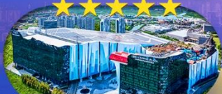
Crowne Plaza Snow World Hotel หรือเทียบเท่า ระดับ 5 ดาว 1 คืน

เชียงใหม่ ดิสนีย์แลนด์ ไอซ์แอนคส์โนวเวิลด์