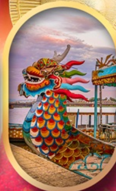
ล่องเรือมังกรแม่น้ำหอม