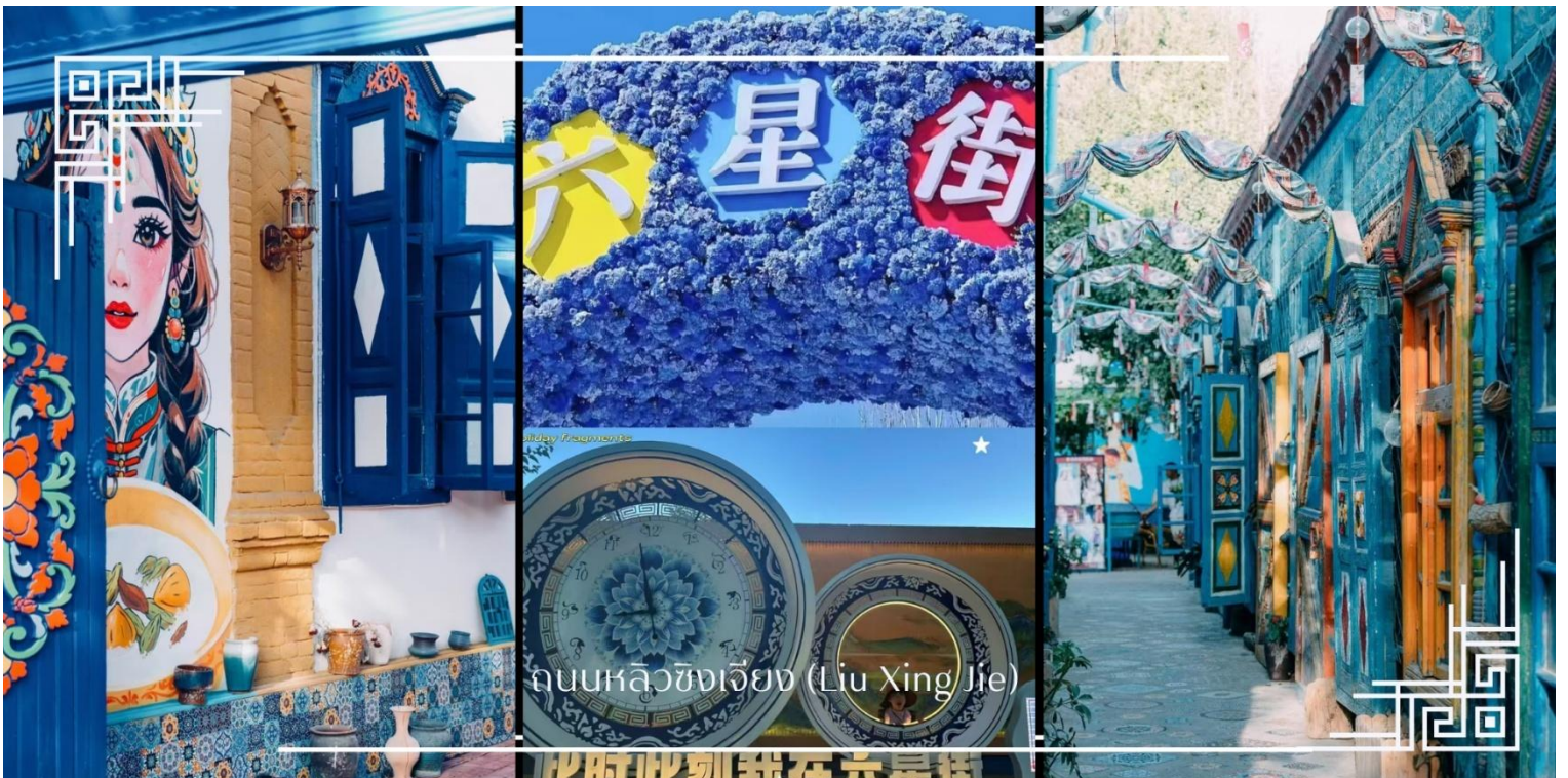
ถนนหลิวซิงเจียง (Liu Xing Jie)

อิสระช้อปปิ้ง ถนนหลิวซิงเจียง (Liu Xing Jie) เมือง อี้หนิง (Yining) ถนนคนเดินที่มีชีวิตชีวาและเต็มไปด้วยสินค้าหลากหลาย เหมาะสำหรับการเดินเล่น ช้อปปิ้ง และสัมผัสบรรยากาศท้องถิ่นอย่างใกล้ชิด สองข้างทางเรียงรายด้วยร้านค้าของฝาก งานหัตถกรรมพื้นเมือง เสื้อผ้า เครื่องประดับ อาหารท้องถิ่น และร้านกาแฟบรรยากาศอบอุ่น โดดเด่นด้วยสถาปัตยกรรมสีสันสดใสที่ผสมผสานกลิ่นอายยุโรปและเอเชียกลางได้อย่างลงตัว