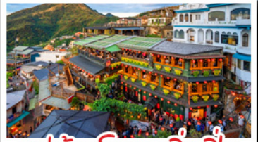
หมู่บ้านโบราณจีวเฟิน