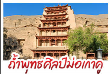
กำแพงมูร์เติลม่อเถาคู

08 - 15 มิ.ย. 69 29,900 15 - 22 มิ.ย. 69 29,900 22 - 29 มิ.ย. 69 29,900 29 มิ.ย. - 6 ก.ค. 69 28,900