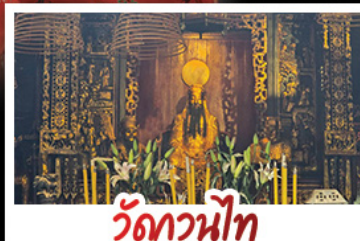
วัดกวนหนี่ท