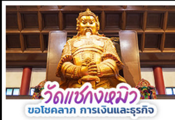
วัดแห่งงเมียว บ่อโชคลาก การเงินและธุรกิจ