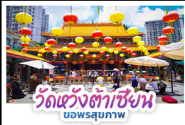
วัดแห่งต้าเซียน บ่อพรสุภาพ