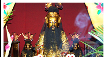
เอียงบูซัว