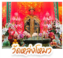
วัดเล่งโงเมว

นั่งรถรางพืดแถมสู่ TOP OF PEAK • ซ้อมบั้งจุใจมกทีก และ CITYGATE OUTLAETS • นั่งกระช้านองปิง สักการะพระใหญ่เทียนถาน • จอพรเจ้าแม่หล่งโหมว แม่ทอง 5 มังกร ให้ประสบความสำเร็จในทุกๆ ด้าน