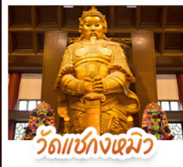
วัดเชกงเมว