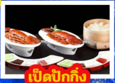
เปิดปิ้งกิ้ง