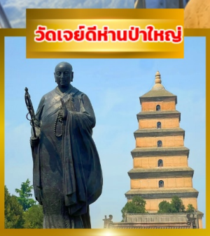
วัดเจย์ดีห่านป่าใหญ่