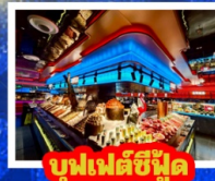
บู๊ฟเฟ่ต์ซีฟู้ด