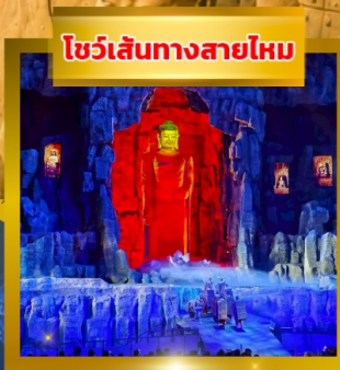
โชว์เส้นทางสายไหม