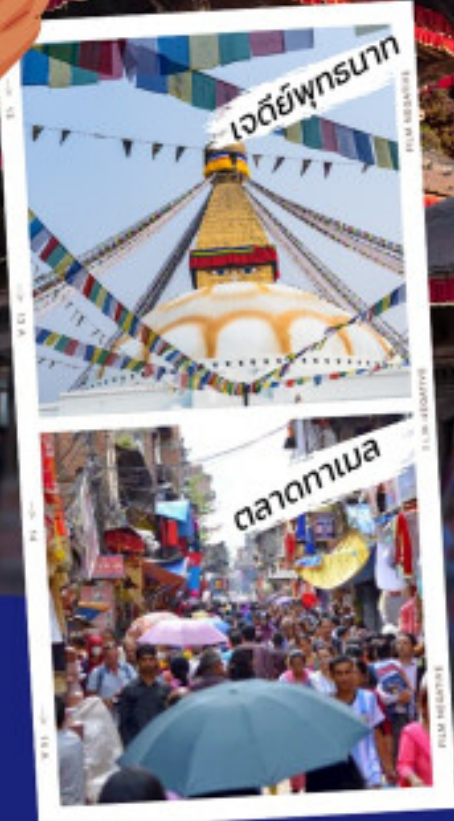
เจดีย์พุทธนาค