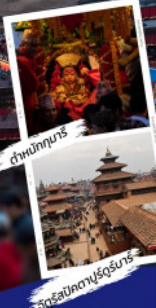
ตำหนักนาริ