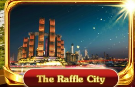
The Raffle City