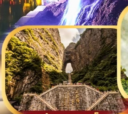
ประตูสวรรค์

ราคา เพียง 27,900.- เดินทาง เมษายน - ธันวาคม 67