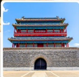
ประตูโบราณหย่งตั้ง