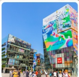
ย่านชานหลี่ถุน