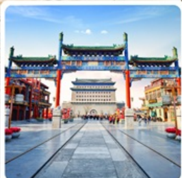
ถนนโบราณเจียนเหมิน