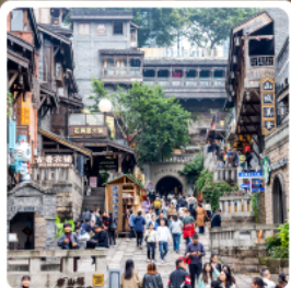
ถนนคนเดินสี่ปาตี้