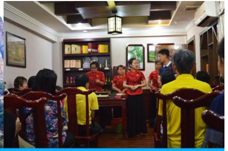
ร้านใบชา