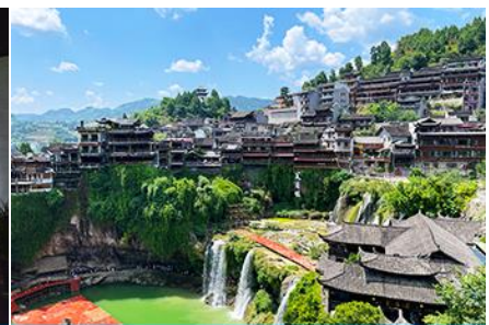
เมืองโบราณฝูหรงเจิน

วันที่สาม เมืองฉางเจียเจีย-ตึกมหาศวรรษย์ 72 ชั้น-พิพิธภัณฑ์ภาพหินทราย –ศูนย์แพทย์แผนจีน-เมืองโบราณฝูหรงเจินยามค่ำคืน