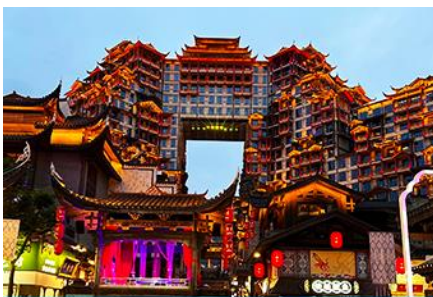
ตึกมหาศวรรษย์ 72 ชั้น

พักที่ CHANGDE YUNXI HOTEL ระดับ 4 ดาวท้องถิ่น หรือเทียบเท่าในเมืองฉางเต๋อ