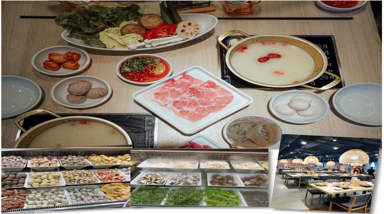
เที่ยง รับประทานอาหารเที่ยง 101 (3) เมนูชาบู