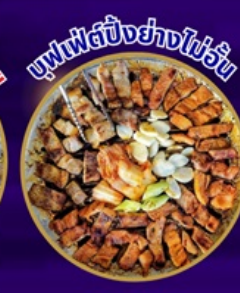
ซูฟเฟ็ตปังปังย่างไข่นม