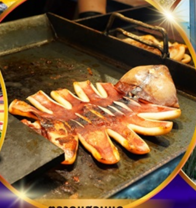
ตลาดแฮอนแด