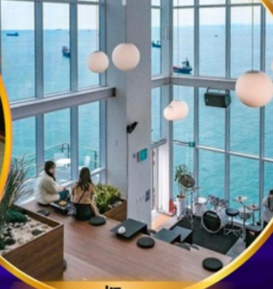
คาเฟ่วิวทะเล

ถ่ายรูปชิคๆ หมู่บ้านวัฒนธรรมคัมซอน เชคอิน คาเฟ่ริมทะเล วิวหลักล้าน ขึ้นเคเบิลคาร์ ชมทะเลปูซาน นั่งรถไฟปิ๊กปิ๊ก sky capsule ห้ามพลาด!! ตลาดปลาที่ใหญ่ที่สุด ชิมของอร่อยที่ตลาดแฮอนแด อิสระช้อปปิ้ง Lotte Duty Free