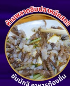
ห้ามพลาดอินปลาหมึกสด!!

ถ่ายรูปชิคๆ หมู่บ้านวัฒนธรรมคัมซอน เชคอิน คาเฟ่ริมทะเล วิวหลักล้าน ขึ้นเคเบิลคาร์ ชมทะเลปูซาน นั่งรถไฟปิ๊กปิ๊ก sky capsule ห้ามพลาด!! ตลาดปลาที่ใหญ่ที่สุด ชิมของอร่อยที่ตลาดแฮอนแด อิสระช้อปปิ้ง Lotte Duty Free