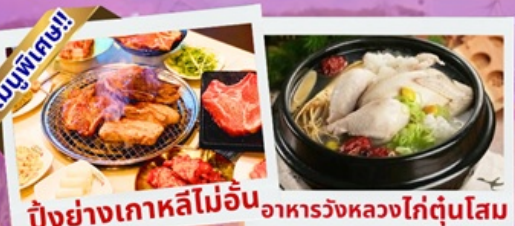
ปิ้งย่างเกาหลีไม่อื่น อาหารวังหลวงใต้ตุ๋นโสม