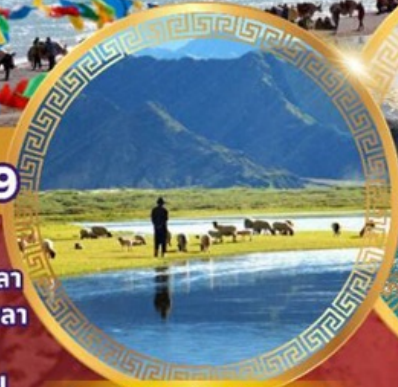
ทุ่งหญ้าทิเบตเหนือ ชางเป่ย์

ลานา พระราชวังโปตาลา วัดโจคัง ถนนแปดเหลี่ยม จุดชมวิวย่อเซ็กมัลลา ธารน้ำแข็งคาโรลา ชิคาเซ่ ช่องเขาจางชัวลา ถนน 108 โค้ง เอเวอเรสต์เบสแคมป์ วัดทาชิลูโบ ทิวทัศน์แม่น้ำหยาลูจางปู ทุ่งหญ้าทิเบตเหนือ ช่องเขานาเคนลา ทะเลสาบนาปูซิว