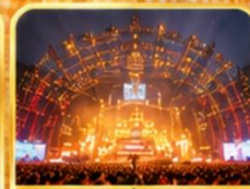
สถานที่จัดงาน เทศกาลเบียร์ชิงเต่า