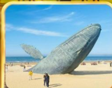
ประติมากรรมวาฬไทยตัน