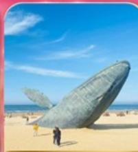
ประติมากรรม "วาฬผู้โดดเดี่ยว"