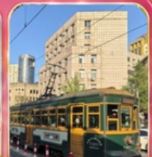
ขั้รถรางไฟฟ้าชมเมือง