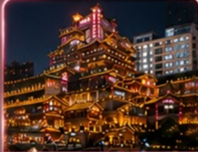
ชมแสงสีหยาต้ง