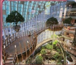
ห้างการค้าเดินถ่วงหวน