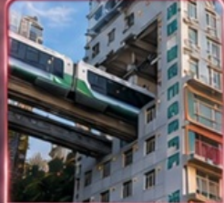
นั่งรถไฟทะลุคัง 2 สถานี