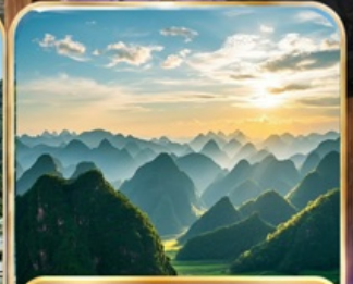
อุทยานป่าภูเขาหมื่นยอด (รวมรถแบตเตอร์)