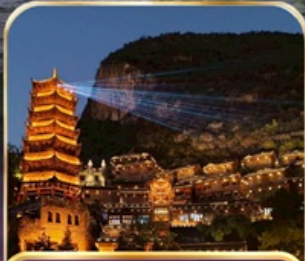
หมู่บ้านโบราณเฟิงหลินชู่ (รวมรถแบต)

คุณหมิง ซิงอี้ เมืองโบราณเฟิงชู่ อุทยานป่าภูเขาหมื่นยอด 6 วัน 5 คืน