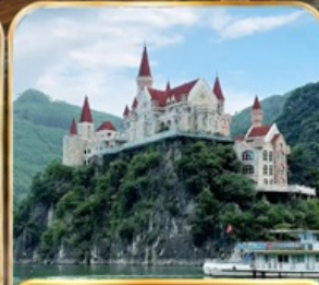
ล่องทะเลสาบวานเฟิงหู