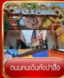
ถนนคนเดินคังปาสือ