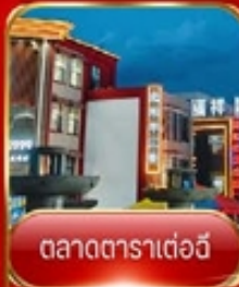
ตลาดตาราเตอ์