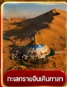
ทะเลทรายอินคินทาลา