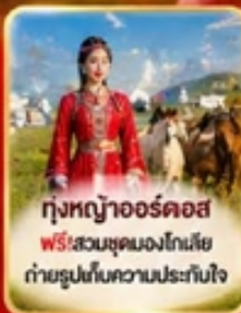
ทุ่งหญ้าออร์ดอส ฟรี! สวมชุดมองโกเลีย ถ่ายรูปเก็บความประทับใจ