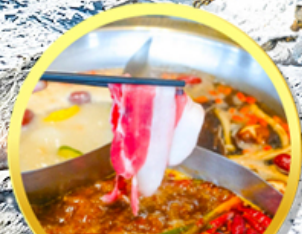
เมนูพิเศษ! สุกี้หม่าล่าเสฉวน