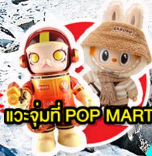
แวะจุ่มที่ POP MART