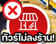
ทิวรี่ไม่ลงร้าน!