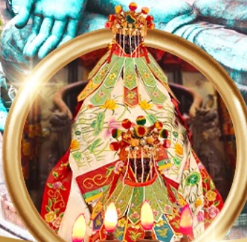
ยืมเงินเจ้าแม่กวนอิมสองฮา