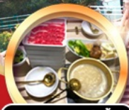
บุฟเฟ่ต์ชาบู เสิร์ฟไม่อั้น!!