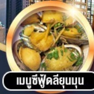
เมนูซีฟู้ดพรีเมียม