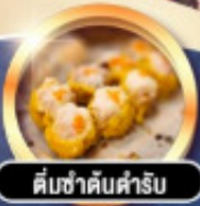
ต้มซ่าดับคำรับ