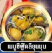
เมนูซีฟู้ดลือลุ่มมุน