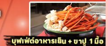
บุฟเฟ่ต์อาหารเย็น + ชาปู 1 มื้อ

รหัสทัวร์ RJ-XJ134 เดินทาง 5D 3N ก.ย. - ต.ค. 2569