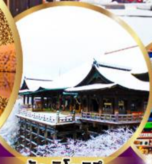
วัด คิโยมิสึ