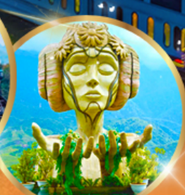
โมนาน่า คาเฟ่