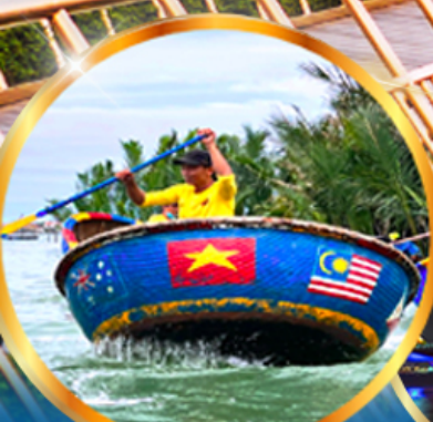
ล่องเรือกระดง